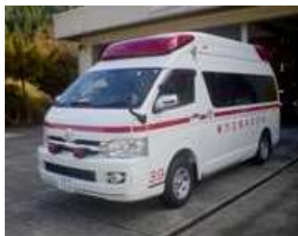
きゅうきゅうしゃ 救急車