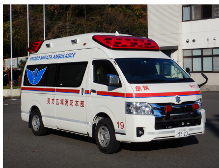
きゅうきゅうしや 救急車