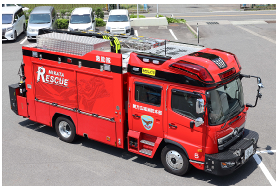
きゅうじょこうさくしや 救助工作車