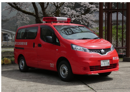
こうほうしゃ 広報車