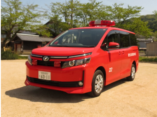
こうほうしゃ 広報車