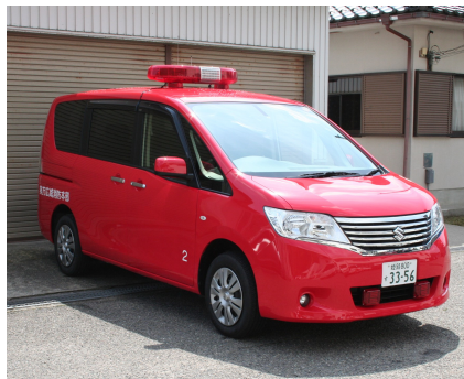
こうほうしや 広報車