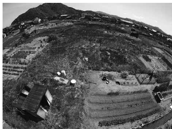
「たき火」が原因で発生した小代区と浜坂地域の「その他の火災」