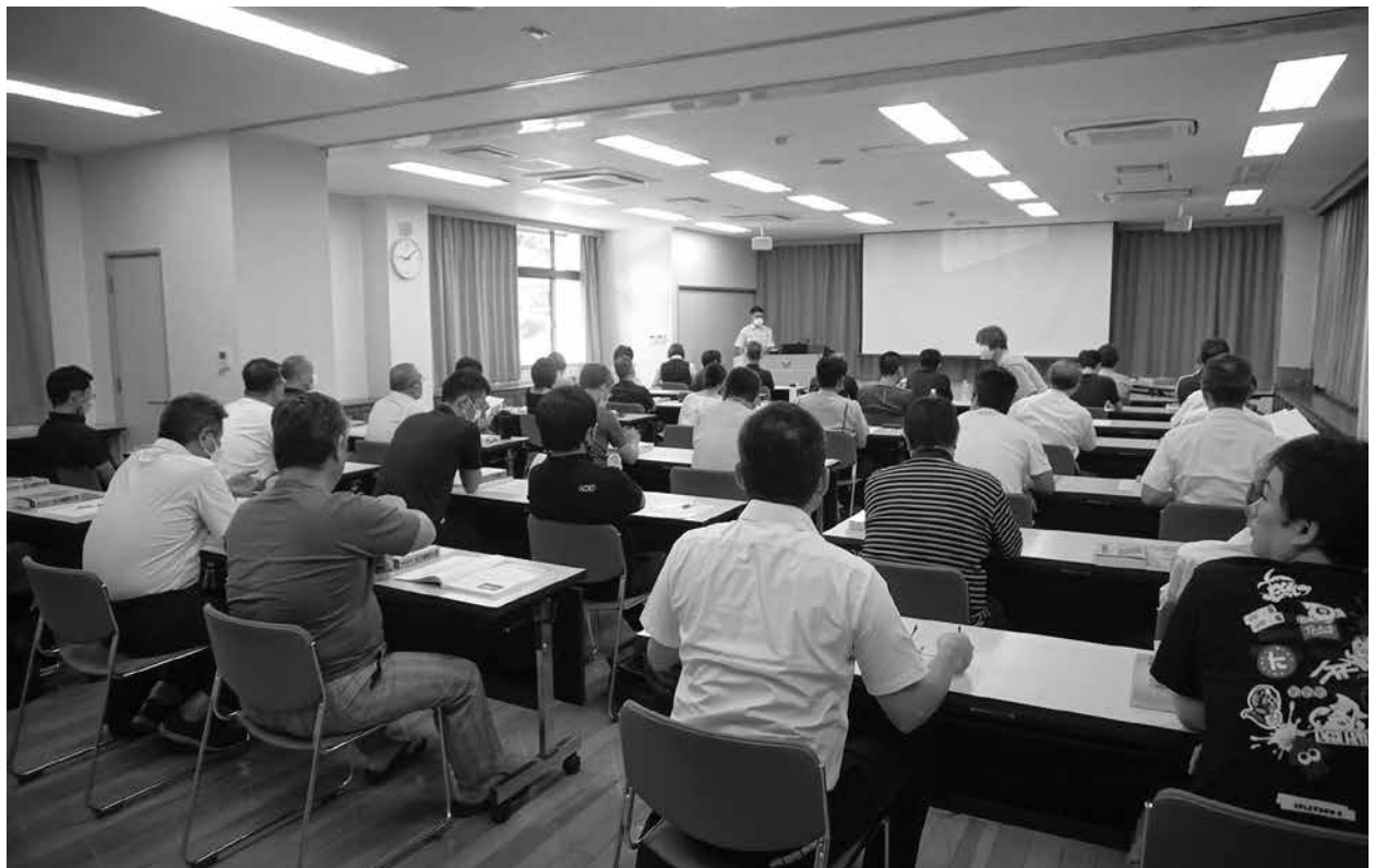
甲種防火管理新規講習会