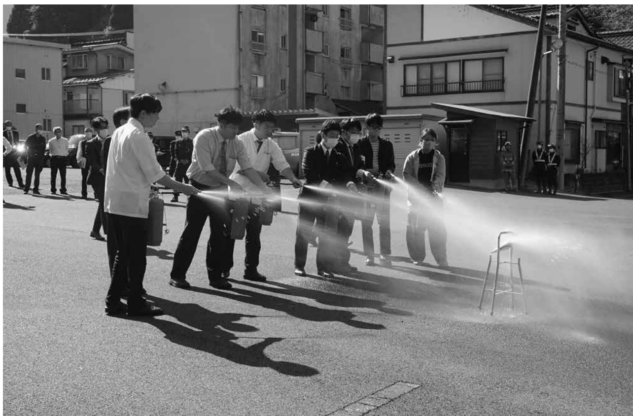
高層建築物火災防ぎょ訓練（湧泉の宿ゆあむ）

また、消防法令の違反是正のため関係機関との連携を図るなど、より一層の防火安全に努めるとともに、法令改正等の周知については、より早く、よりの確な情報を共有する組織づくりを合わせて実施し、火災等災害に強い体制づくりに期するよう予防業務を推進しています。