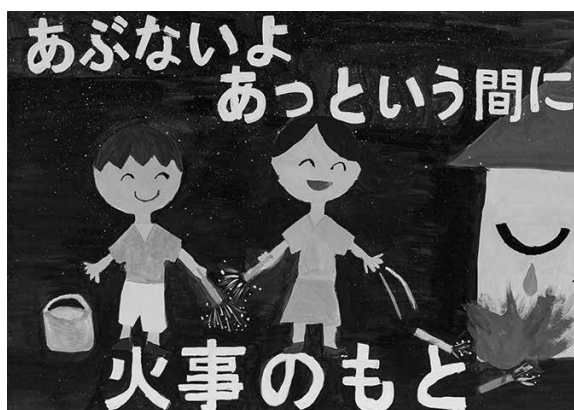
美方郡広域事務組合管理者表彰最優秀賞